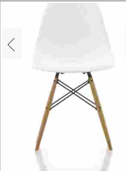
1 - 4 PLASTIC SIDE CHAIR DI CHARLES & RAY EAMES PER VITRA.